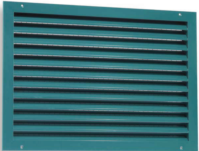
Dargestellt ist eine pulverbeschichtete Ausführung ohne Mittelsteg